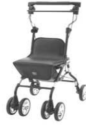
ライトステップ・タイニ