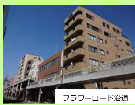
フラワーロード沿道