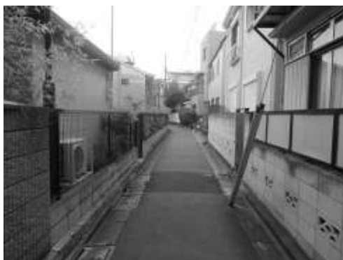
幅が 4m未満の道路 (他地区事例)