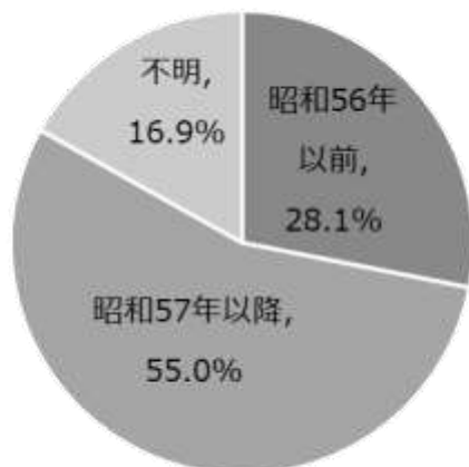
建物の建築年次割合（平成 28 年） 建物登記簿による（未登記建物は含まれません）