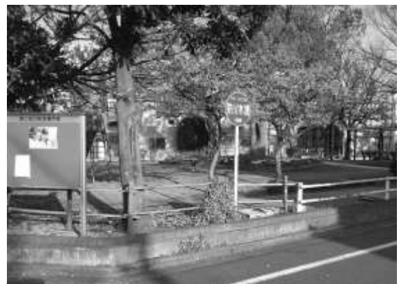
広場に設けられた防火水槽