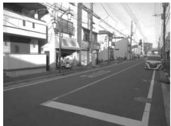
今井街道沿いの商店街