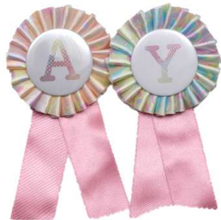
ロゼット 1,650 円 デザイン：女子美術大学 栃倉 由葵