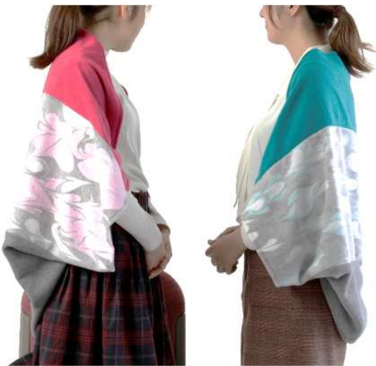
ブランケット 膝掛け/ケープ 11,000 円 デザイン：女子美術大学 田島 史菜