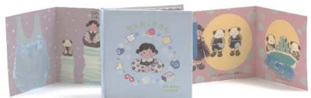
絵本 販売予定なし デザイン：女子美術大学 栃倉 由葵