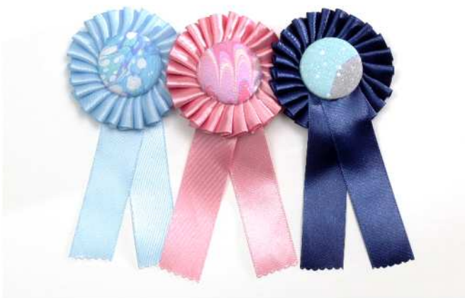
ロゼット 1,100 円 デザイン：女子美術大学 栃倉 由葵