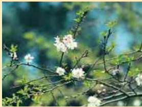
ジュウガツザクラ