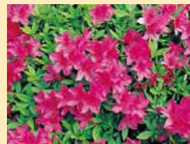
オオムラサキツツジ