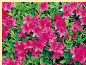
オオムラサキツツジ