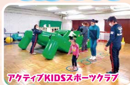
アクティブKIDSスポーツクラブ