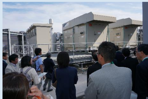
■発電機等の設備（屋上）