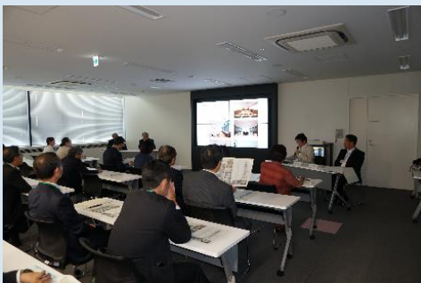
■浦安市からの概要説明