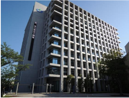
■浦安市役所の全景

6月3日（月）に開催した第2回策定委員会では、2016年5月に竣工した浦安市役所の新庁舎を見学しました。ここでは、その様子をお伝えします。