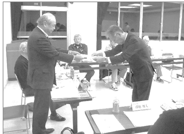
【審議会より施行者への答申状況】