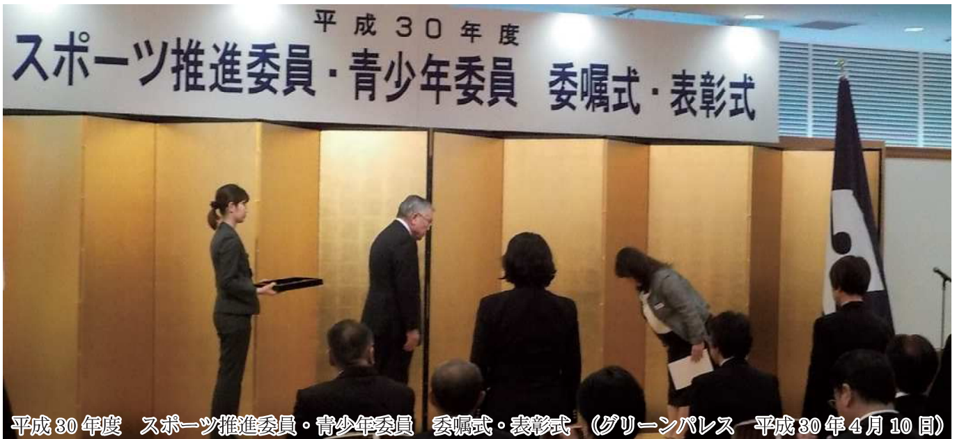
平成30年度 スポーツ推進委員・青少年委員 委嘱式・表彰式 (グリーンパレス 平成30年4月10日)