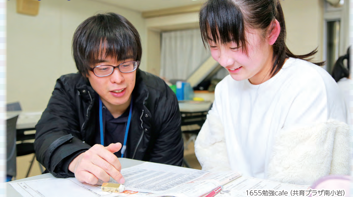
1655勉強cafe(共育プラザ南小岩)

毎年約6千人の子どもが生まれる江戸川区ですが、社会や経済の変化に伴い、子どもや子育て世帯を取り巻く環境は複雑で多様になっています。