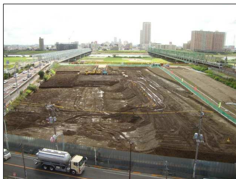
～平成 27 年 8 月 11 日現在の地区内の状況です～

A3 企業者の説明会を 9 月くらいに考えていますので、それまでに「皆さまの事情を考慮しない場合、標準的にはこういう配置になります」というものを示せるように調整していきます。