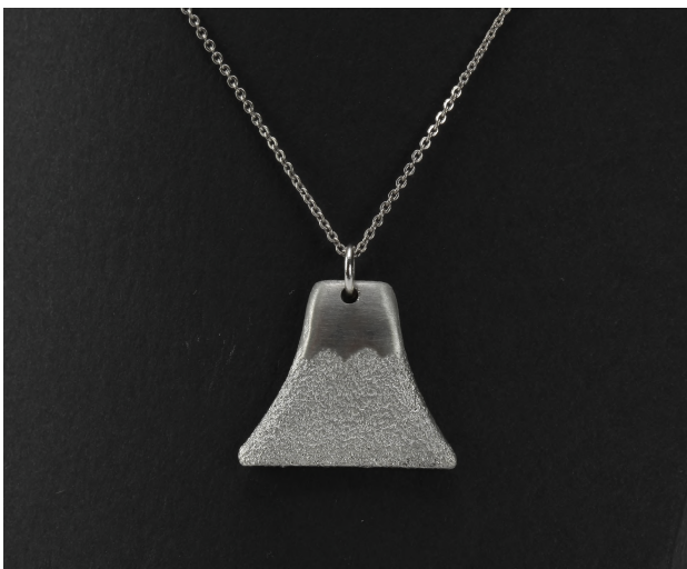
ネックレス 2,160円 デザイン：女子美術大学 小林 令奈