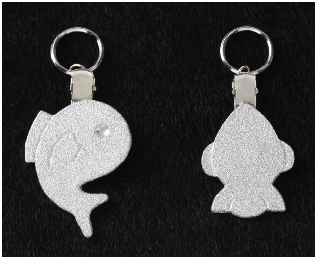
キーホルダー 各 2,160 円 デザイン：女子美術大学 山崎 千夏