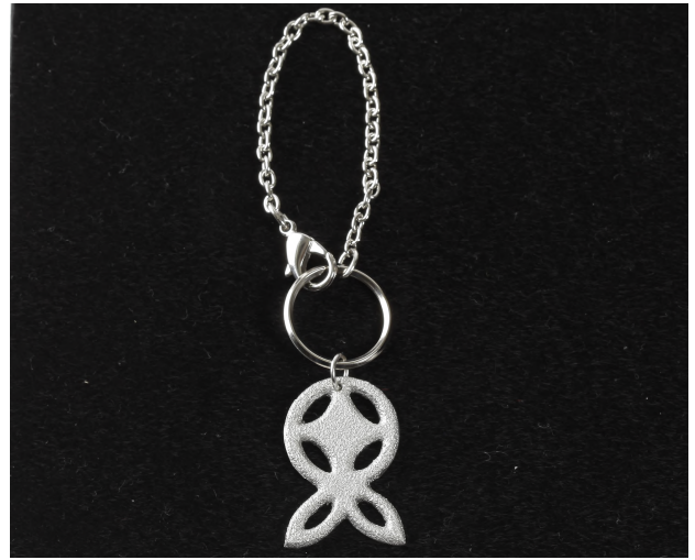
キーホルダー 販売予定なし デザイン：女子美術大学 山崎 千夏