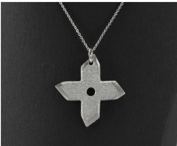
ネックレス 販売予定なし デザイン：女子美術大学 小林 令奈