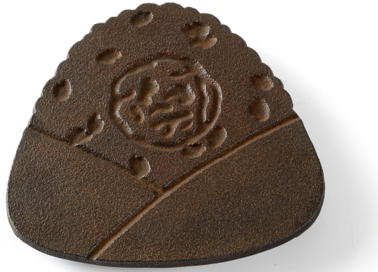
鍋敷き 4,212 円 デザイン：女子美術大学 南澤 愛美