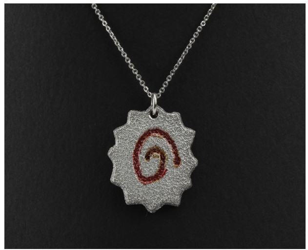
ネックレス 販売予定なし デザイン：女子美術大学 小林 令奈