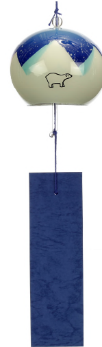
江戸風鈴 3,456 円 デザイン：女子美術大学 堀 ヒカル