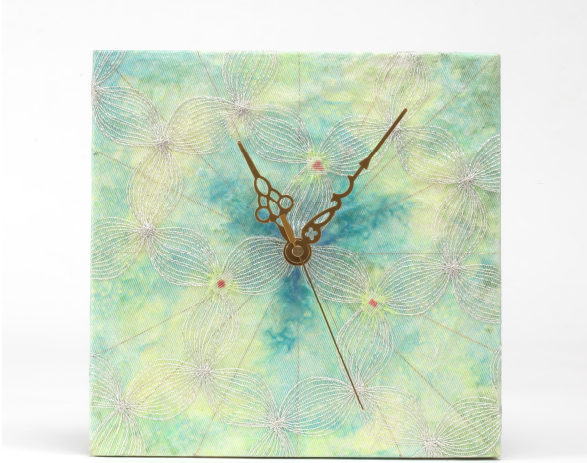
時計 5,400 円 デザイン：女子美術大学 松本 英理