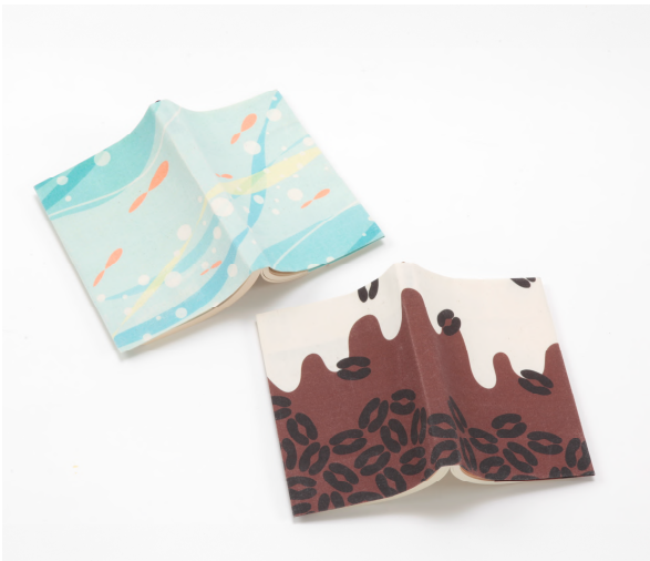
ブックカバー 各 1,404 円 デザイン：女子美術大学 山口 真千加