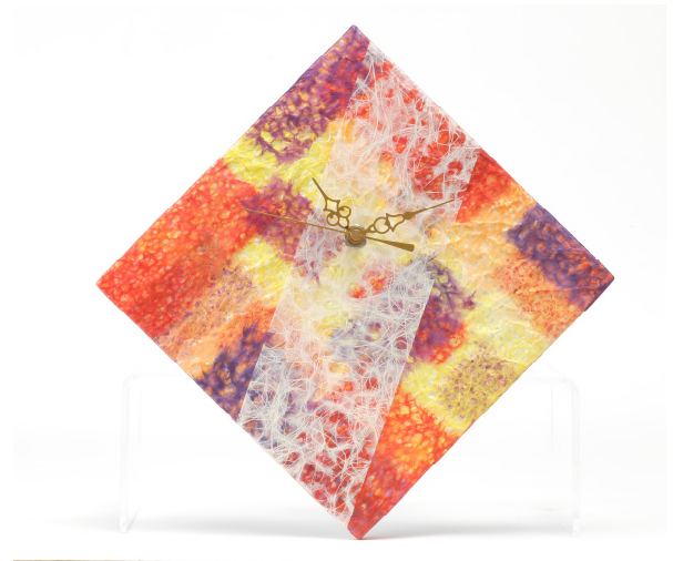
時計 5,400 円 デザイン：女子美術大学 山口 真千加