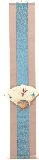
表装扇子掛 43,200 円 デザイン：女子美術大学 松本 英理