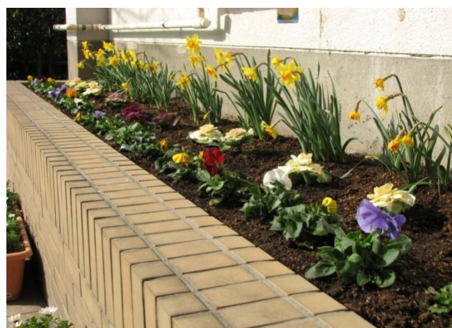
学校整備ボランティアの支援で整備された花壇

本校では「まちで育つ」をキャッチフレーズとして、地域ぐるみでの教育活動を展開しております。そのためには、地域の皆さまの応援が不可欠です。地域の方に生徒を見守っていただく中から、生徒自身も地域で育てられているという気持ちをもつと思いますので、引き続きのご支援をよろしくお願いいたします。