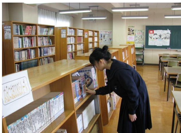
学校整備ボランティアの支援で整備された図書室

昨年度と同じ程度の活動ができていますが、活動の輪があまり広がっていません。ボランティア登録を一層募って、活性化していきたいと思います。さらに、生徒を入れた取組に発展させていきたいと思います。