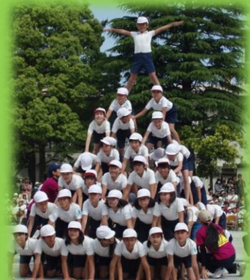
開校 80 周年記念運動会