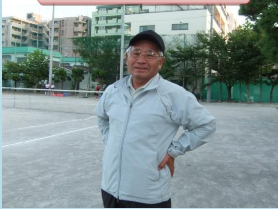
部活動指導(ワフテニス部)