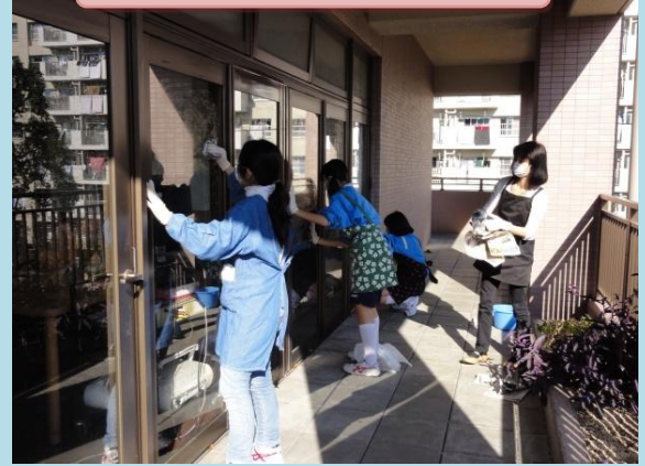
和楽苑でのボランティア