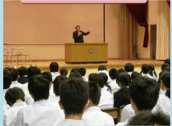
社会人の話を聞く会