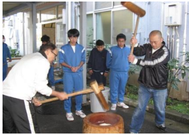
7組（特別支援学級）での もちつき PTA有志