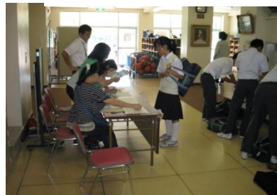
英検・漢検・数検ボランティア PTA有志 二之江中学を愛し育てる会