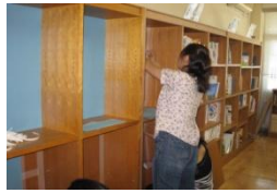
図書ボランティアによる 図書室整備 PTA有志