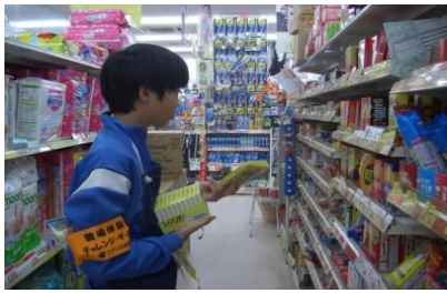
職場体験事業所協力 PTA有志、三江会 二之江中学を愛し育てる会