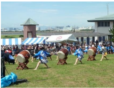
部活動発表会への協力 二之江中学を愛し育てる会