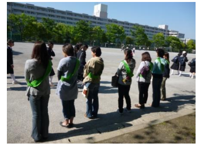
朝のあいさつ運動 PTA有志