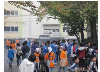
二之江中ふれあいフェスタ おやじの会、三江会 二之江中学を愛し育てる会