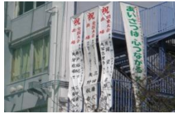
毎学期の生活標語の募集 全国大会出場者への顕彰 二之江中学を愛し育てる会