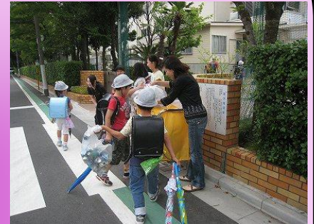
アルミ・スチール缶回収