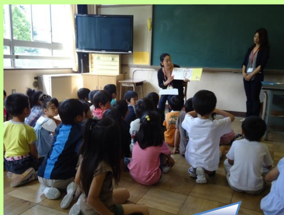
図書ボランティアによる読み聞かせ