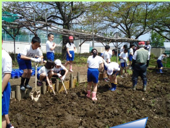
田んぼの活動への支援