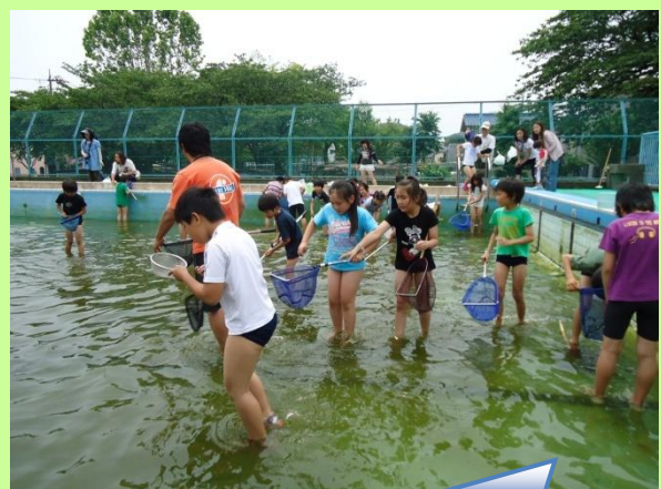
情操豊かな教育への支援