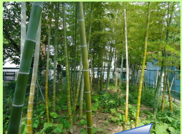
竹林栽培への支援