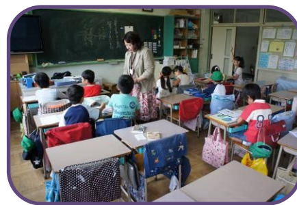
アシスタントティーチャー（算数）