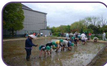
「みんなの田んぼ」で田植え