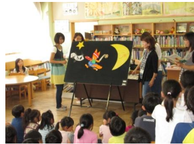
読み聞かせ・環境整備・プランナー