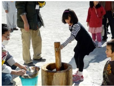
もちつき(おやじの会)