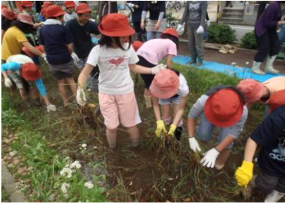
七小田んぼでの田植え（5年生）