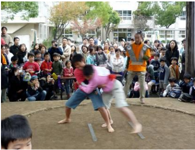
七小ともだちまつり(PTA)