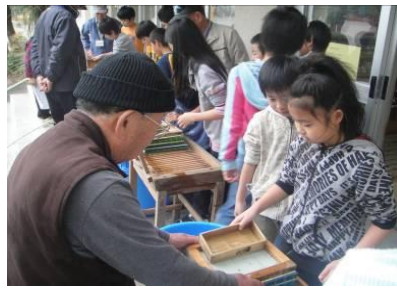
のりすき体験（4年生）