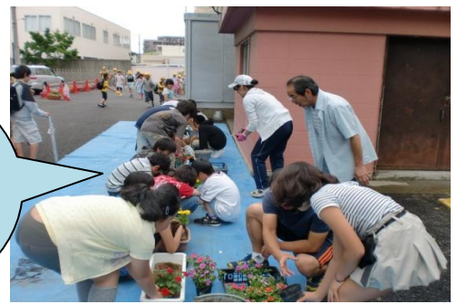
園芸委員会（花壇の整備）