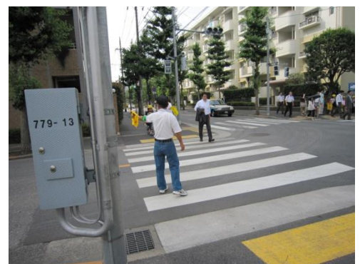
登下校見守り隊による登校時の旗振り

なお、登校の際には、PTAの方々にも旗振り当番として街角に立っていただいています。