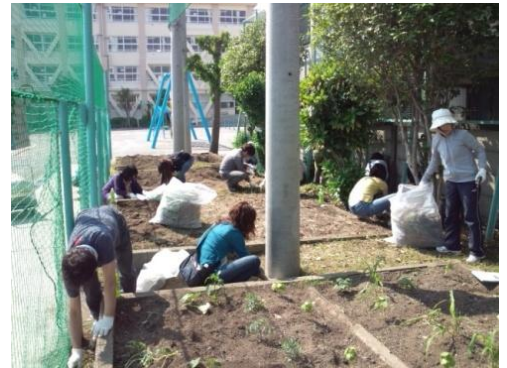
PTAサポーターの皆様による学校整備

こうした取り組みは、周囲からはなかなか気づかれにくいことです。しかし、こうした学校応援団の皆様の支えがあって、学校（教師）は子供たちの教育活動に専念することができます。