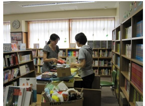
図書ボランティアによる図書室整理

ほかにも、図書ボランティアの方々は、図書室掃除当番の子供たちに、図書室の掃除の仕方などもていねいに教えてくれます。