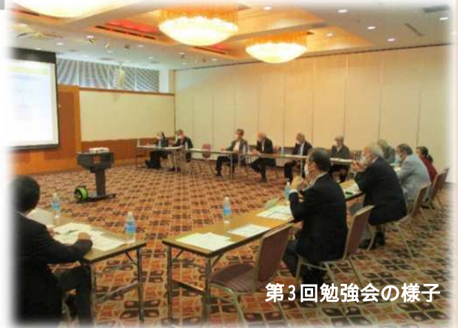
第 3 回勉強会の様子