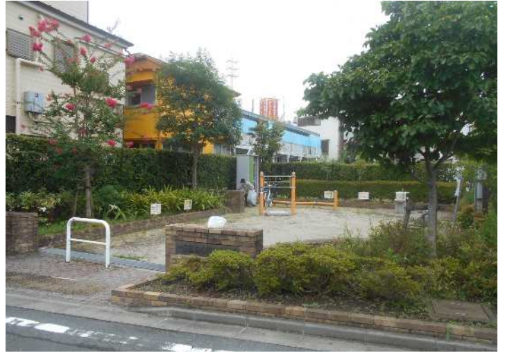
一之江なんぶひろば (764㎡)