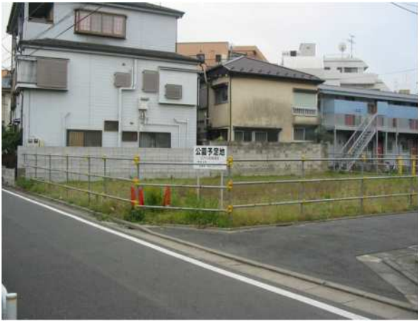
一之江もくれんひろば (210㎡)