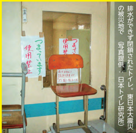
排水ができず閉鎖されたトイレ。東日本大震災の被災地で

自宅が無事で在宅避難ができて、トイレが使えないと滞在は困難になります。また、トイレの環境が悪いとつい水分の摂取を控えてしまい、それが原因で熱中症やエコノミークラス症候群になってしまうかもしれません。衛生環境の悪化は感染症の蔓延を誘発する恐れもあり、トイレの確保はまさに在宅避難の最重要課題といえます。